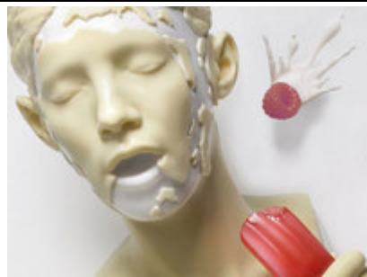
מתוך התערוכה "אפרודיזיאק - עושר העמים" (אלי גור אריה)

יום רביעי, 9 במאי 2007, 14:18 מאת: רומי מיקולינסקי, מערכת וואלה!